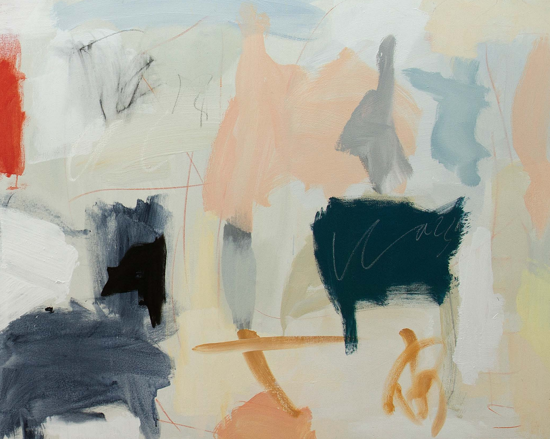
Rencontres (2016) / 100 x 250 cm / acrílico y óleo sobre lienzo