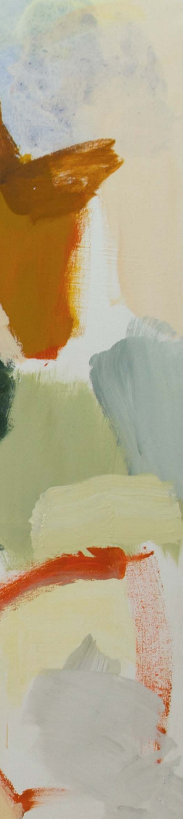
Un lugar en el mundo (2016) / 140 x 180 cm / acrílico y óleo sobre lienzo